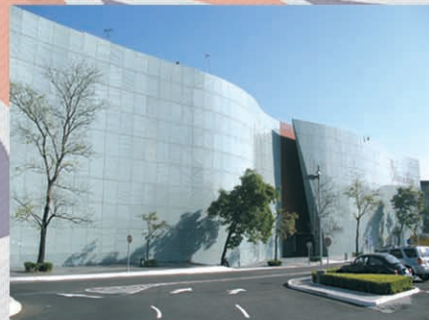
Città del Messico